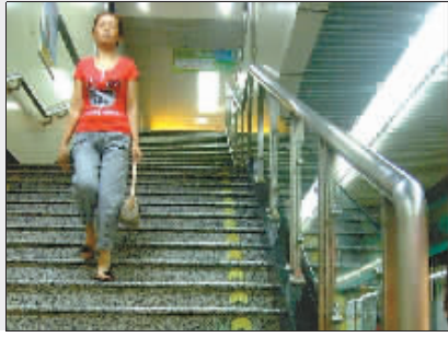
智能红绿灯 江北洋河东路设学生专用 洪崖洞电梯按钮配盲文 部分路桥收费站栏杆装有防撞装置 千厮门梯道建歇脚凉亭 家具收集点 九龙坡居民区出现废弃 观音桥隧道前设车辆测高标杆 主城区公厕改造有了儿童小便器 三峡广场设全国首个公众服务中心 解放碑商务区推出停车位诱导系统 轻轨地下车站配置荧光指路小箭标