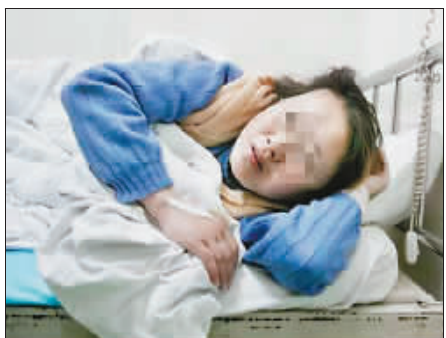
危急时刻孕妇签字自救