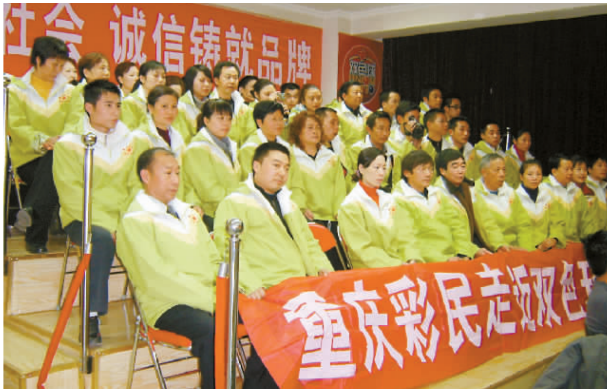
重庆彩民在双色球摇奖大厅导播间观看摇奖

消息传出后,国内媒体争相报道,彩民奔走相告,同时也有部分网民对此大奖提出了质疑和猜测。对此,本报采访了当期重庆彩民“走进双色球”代表团成员,揭秘了此次亿元大奖诞生的详细过程。