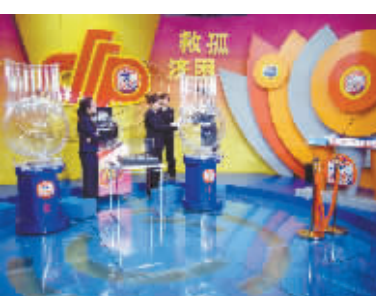
工作人员装进第一套摇奖用球