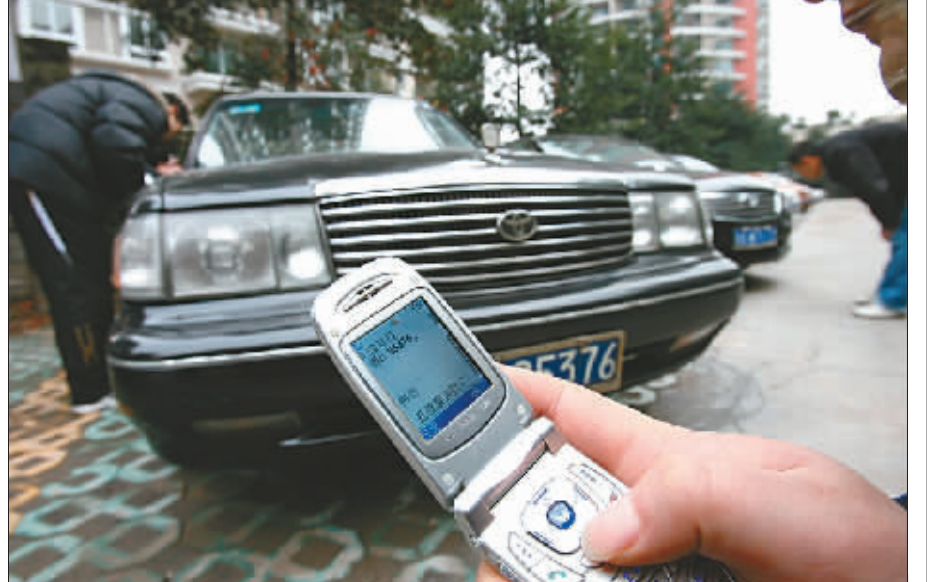
侦查员用手机警务通功能上网确认了一辆“粤”字头假牌照皇冠车

9月12日晚,杨家坪一酒店门前,便衣侦查员发现一辆车牌为渝B09XX的白色“海马”轿车可