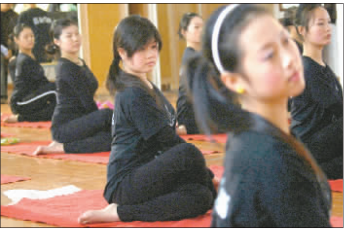
长江职中女生进行形体训练

社会各界对此更是议论纷纷,不少人认为空姐的美应该是自然的,并不是靠人工打造。而一些航空公司也表示,选空姐并不是将外貌作为最重要的标准,而更看重内涵和亲和力。