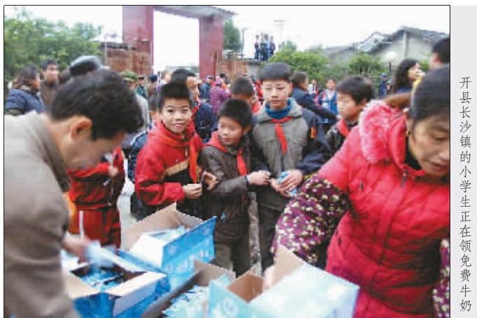
开县长沙镇的小学生正在领取免费牛奶

为帮助更多需要技术支持的困难群众，市慈善总会和晚报爱心基金开通帮扶热线966988，继续征集愿提供技术支持的爱心企业。