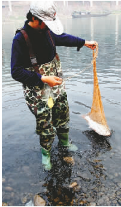
见钩钩住了一条三四公斤的大鱼

记者连续几日走访两江四岸发现,每天至少三百人在围剿江中产子鱼。市农业局渔政处表示,禁渔期间违规捕捞、经营、贩卖江河鱼者经查获,一律按法定上限处罚,对个人最高可罚款5万元。若有市民发现违规捕鱼钓鱼行为,可通过110或直接向当地渔政部门举报。 记者 丁香乐 实习生 张洁