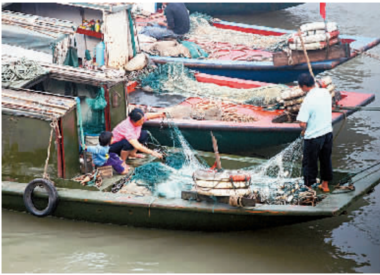
渔民们在清理渔网,查看网中的收获。