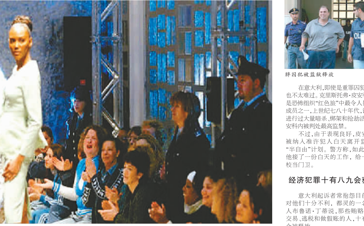
意大利监狱办时装秀

意大利的监狱系统面临着一个危机:原本规模仅囚禁4.3万名犯人的监狱现在要挤下6万多人。于是政府想出了一个应急措施:打开牢门,把超过三分之一的犯人放了出来。由于犯人数量锐减,意大利一度出现了监狱看守人员比犯人还要多的局面。 不用担心会坐牢 意大利的法律体系植根于严酷的罗马帝国法制,后者以把犯人钉到十字架上或送去喂狮子而闻名。不过从那时起,意大利的法制开始逐渐演变,融入了宽大精神,还在一定程度上糅合了世俗社会的行政风格。被告有权上诉两次,甚至连交通违规收到罚单也可以向最高法院上诉。意大利的法庭常常是人满为患,以至于大多数重罪的最终裁决还没下来,法定时效期就已经过了。 有罪照样当总理 面对如此状态的司法体系,即便遭起诉,一个人的声誉也不会受到太大影响。从三次出任意大利总理的贝卢斯科尼就可见一斑。此人曾是十多宗刑事案件的调查对象,至少有六七次被传唤出庭,涉嫌案件从逃税到贿赂法官,各种各样。换作在其他地方,这样的法律纠纷恐怕早已葬送了政治生涯,而贝卢斯科尼在民意调查中居然还能领先,并且刚刚第三次当选意大利总理。 六年徒刑不用坐一天牢 意大利糟糕的监狱设施也难辞其咎。萨尔瓦多·费兰蒂被指控是西西里最凶狠犯罪家族的党羽,但前不久他被监狱释放,改为软禁,理由是:他太胖了,监狱里没有足够宽敞的床能容下他462磅的身子。意大利2006年出台了赦免计划,至今已经释放了2.7万名犯人。具体操作有点像打折优惠。除了参与恐怖袭击、涉及黑手党等犯罪的囚犯,其他人一律可以减免三年的牢狱。 经济犯罪十有八九会获释 意大利起诉者常抱怨目前情况对他们十分不利,都灵的一名起诉人布鲁诺·丁蒂说,那些贿赂、内幕交易、逃税和做假账的人,十有八九会被释放。 重刑犯白天可外出兼职 之前已有法律规定,被判三年以下监禁的犯人可以社区服务来代替坐牢。所以,现在被判六年监禁的犯人意味着他们可以一天牢都不用坐。