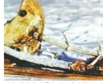
北极圈冰冻地面上的卫星残骸