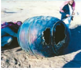
落在沙特的发动机外壳