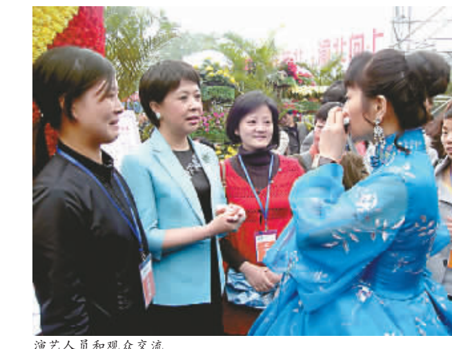
演艺人员和观众交流

本报讯 昨日,央视三套“激情广场”栏目“四进社区”群众文化特别节目——重庆渝北篇走进渝北区两路,2000名市民与明星们同台献艺,台下,万余观众齐唱“和谐风”。 “四进社区”活动是根据中央文明委安排,中央文明办、中央综治办等从2002年开始,共同举办。渝北区委宣传部宣讲文艺科科长胡佳介绍,2007年,全国22个城市递交了创建“全国文明城市”申请,其中8个城市被确定为全国文明城市先进区。2008年,由中央文明办主办,结合央视三套“激情广场”栏目,“四进社区”活动在8个城市轮流开展。 72岁高龄的马玉涛,被誉为空政文工团第五代江姐的王莉、山城妹子张迈等众多明星纷纷登台献艺,渝北市民表演了《川江号子》、《放牛娃》和《渝北大嫂夸社区》等节目,渝北临时组建的文化、建设、市政、空港、卫生、街道等方阵,还进行了现场赛歌表演。 著名主持人刘璐告诉记者,“四进社区”活动依托“激情广场”走进社区,希望能进一步丰富社区文化生活,宣传普及科学知识,增强居民法律意识,提高居民生活质量,真正为渝北区带来文明和谐。