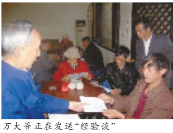
王大爷正在发送“经验谈”

500元,除工资外,低保户还可领取100元的低保补差和350元的再就业补贴。如再就业收入超过低保金为700元,低保户还可多领取420元。“没有补贴,不找工作都一样,有了补贴,低保户再就业得到了实惠。” “政策好,宣传也很重要。”廖万敏说,以前,因对政策理解不够,虽有社保补贴和再就业补贴,低保户不愿接受。补充通知出台后,社区加大了宣传力度,反复开会讲解,有的低保户一天询问四五次,仍不相信有如此优惠政策。最终,因为理解了,觉得再就业更划算,低保户们遂争着再就业。 本报渝中社区记者 陈静