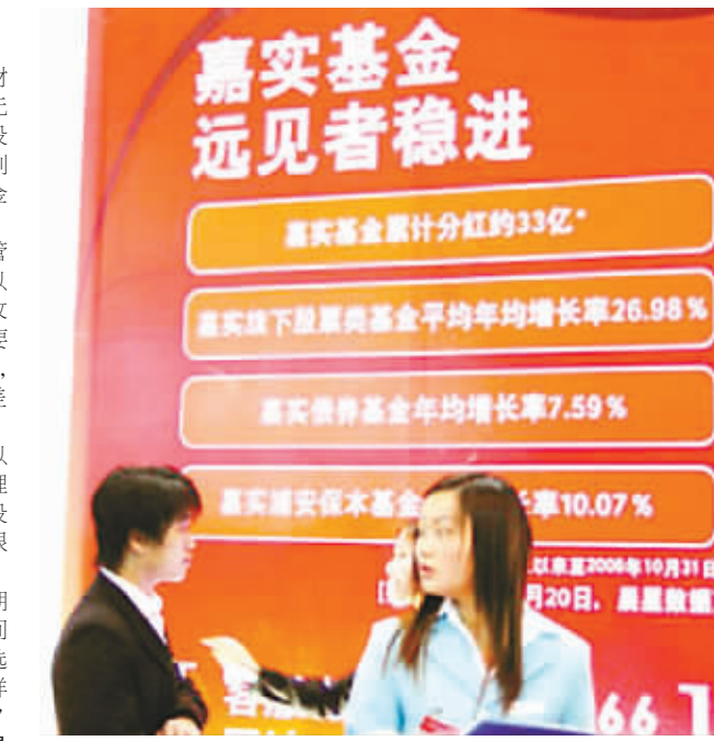
银行理财产品宣传不能再炒噱头