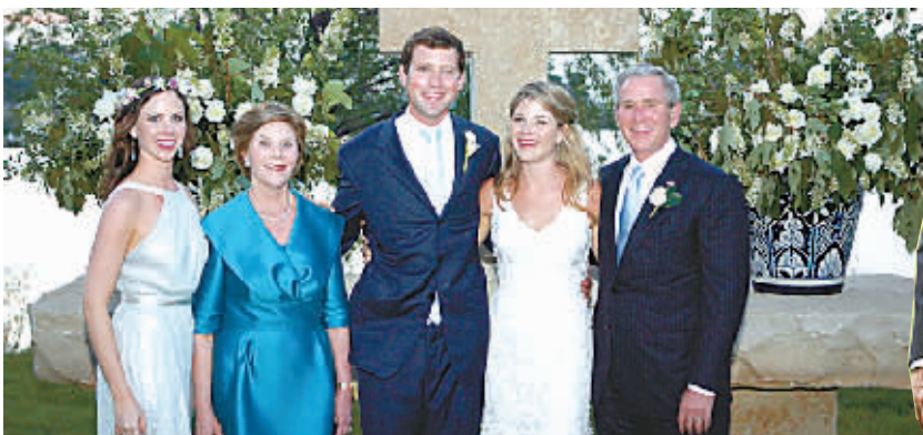
布什(右一)、夫人劳拉(左二)、女儿芭芭拉(左一)与新娘詹娜(右二)、新郎黑格(中)

美国总统布什的小女儿詹娜·布什已于5月10日与爱人亨利·黑格在老家得克萨斯州举行了婚礼。由于严格限制媒体提前报道,民众直到11日才从白宫公布的婚礼照片上一睹“第一女儿”大婚的盛况。准备返回华盛顿的布什夫妇也开口与大家分享嫁女后的喜悦心情。