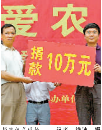
捐款仪式现场