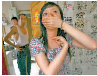
娟娟讲述当时情景