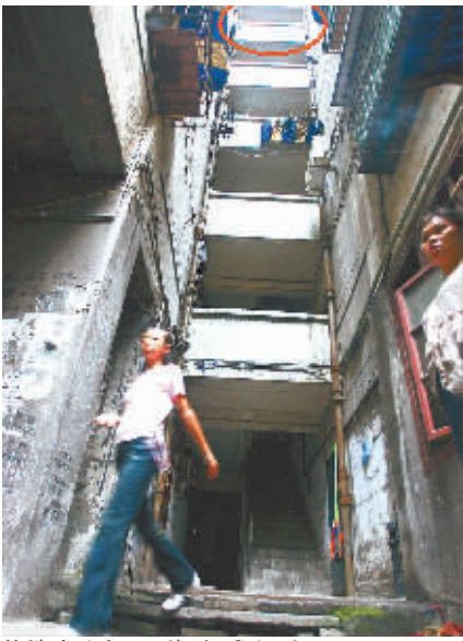
惊慌的歹徒从六楼(红圈处)跳下