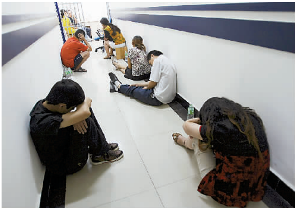
犯罪嫌疑人落网后,垂头丧气地等待接受审查。

昨天下午,杨家坪重百大楼17-5,守在这里的协勤队员正在向几个年轻人解释:“这是骗子公司,大家不要再来了。”几个求职者看