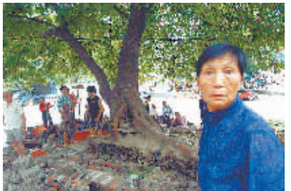
黄葛古道“迎客树”面临水泥枷锁,当地居民表示不满。

据了解,目前涉案的11人中10人被刑事拘留,一人取保候审。警方提醒受害人直接与杨家坪派出所联系,电话:68422719,联系人:穆警官。 记者 谈露洁