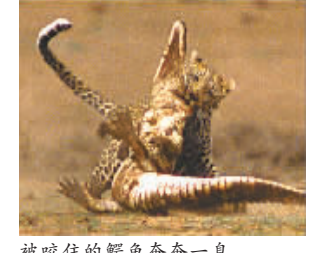
被咬住的鳄鱼奄奄一息