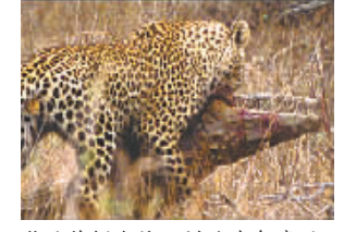
豹子将鳄鱼拖入树丛准备享用

据英国《每日邮报》报道,豹子与鳄鱼向来是井水不犯河水,但最近美国野生动物摄影师哈尔·布莱德利(Hal Brindley)在南非狩猎动物保护区,拍摄到了一只花豹向鳄鱼发起攻击,用镜头记录动物世界这种惊人瞬间可能还是第一次。