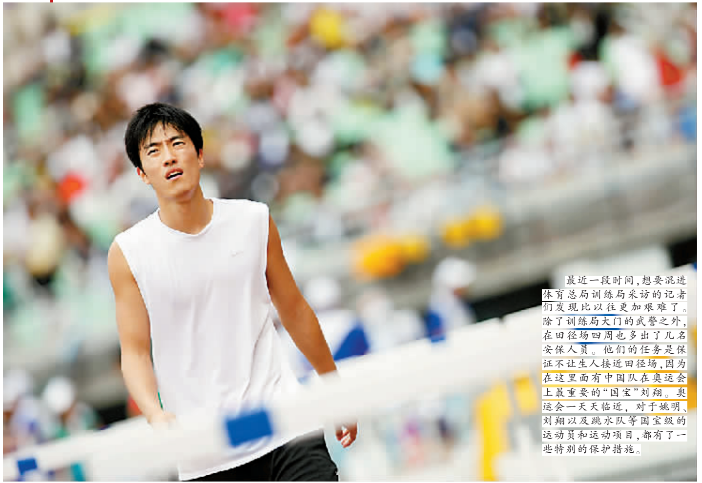
刘翔的生活相当不自由