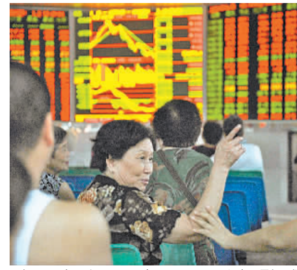
大盘终于迎来反弹,股民十分高兴。