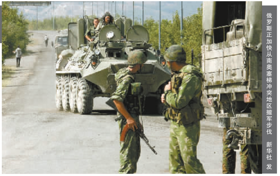
俄罗斯正加快从南奥塞梯冲突地区撤军步伐

交换俘虏当天,有消息显示,俄罗斯已经关闭了与格鲁吉亚和阿塞拜疆的陆地边境,禁止非独联体公民出入。俄罗斯总理普京签署的命令说,这是为了“阻止恐怖组织成员进入俄罗斯以及防止武器走私”。 格鲁吉亚总统萨卡什维利8月12日宣布第比利斯将退出独联体,格鲁吉亚议会两天后批准了这一决定。 目前,俄罗斯与格鲁吉亚的海陆空联系已经中断,这对严重依赖对俄贸易的格鲁吉亚经济来说是一个沉重打击。 据中国日报网