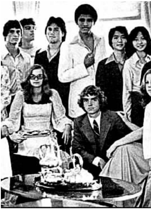
奥巴马和青年时代的夏威夷岛昔日好友

据美国《环球杂志》昨日报道,为了毁掉奥巴马的总统梦,其政敌者悬赏100万美元,聘请多名前CIA特工秘密成立了一个“奥巴马丑闻调查小组”,试图找出奥巴马有一名私生子的证据!奥巴马对此显然有些措手不及,于日前火速派人前往他度过青年时代的夏威夷岛,命令昔日好友对他的历史“集体闭嘴”。 “丑闻”可能发生在20岁时 据内幕人士披露,过去1个多月来,“奥巴马丑闻调查小组”对奥巴马的过去展开了深挖式调查,试图找到能对奥巴马“产生致命伤”的情报。 多年来,奥巴马的反对者一直传称,在奥巴马20岁左右时,很可能曾与一名年轻女友发生过一夜情,并导致其怀孕。最终,那名女子为奥巴马生下了一个孩子。内幕人士称:“如果真的有任何私生子存在,那些前CIA和军方情报部门的特工一定能找到。”而如果真的找到,这个调查小组将获得奥巴马政敌者悬赏的100万美元。