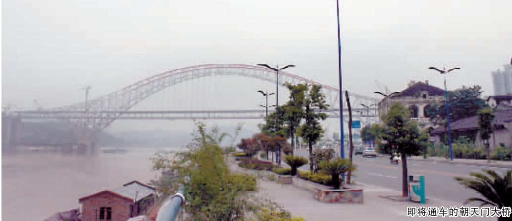
即将通车的朝天门大桥

背景 南滨路，是重庆这样一个山水城市中能同时拥有江景、山景资源的区域，已成为重庆人居的第一成熟大道。南滨板块也因各类物业形态产品的规划建设而成为最具人气的旅游观光带和最具品位的人居环境地带，随着朝天门大桥通车的立体交通网络构建，一个变化中的不断完善的新南滨生活圈呈现在市民的眼前。