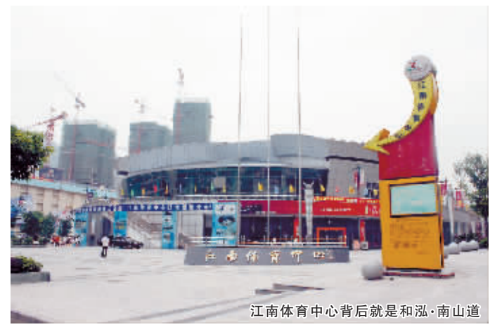
江南体育中心背后就是和泓·南山道

在南滨，这个“金三角”对海棠溪和弹子石功能的分工和协作有如画龙点睛的作用，它促进南滨形成“一角、双核、多中心”的发展格局，它像锁扣一样锁住双核，既独立又相互支撑。它和双核共同成为一个新的经济产业带，集休闲、运动、娱乐、旅游、度假经济为一体，不但成为重庆人接待外地朋友的必到之地，也成为了很多外地人了解重庆市民生活的一面镜子。