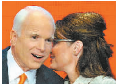
麦凯恩和佩林动作亲密