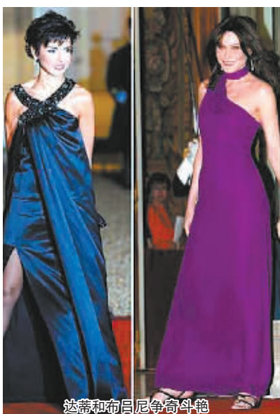
达蒂和布吕尼争奇斗艳