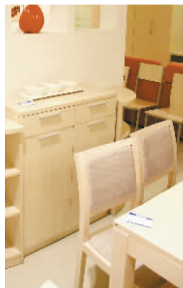
板式家具价格大“抄底”

日前，红星美凯龙宣布，将全面启动“首届全球家居采购节”，多达上万品种的全球品牌家居产品将扎堆亮相红星美凯龙，让消费者享受优惠的同时，欣赏到今年最新的潮流新品和家居文化体验。板式家具作为家具类别中的一大门类，不少品牌的“疯狂让利”无疑让顾客分得最大一块“蛋糕”。