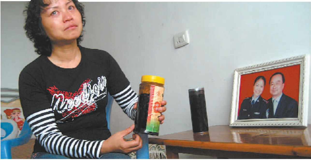
葛元凤为丈夫泡的降压药还在，可他却不在在了。