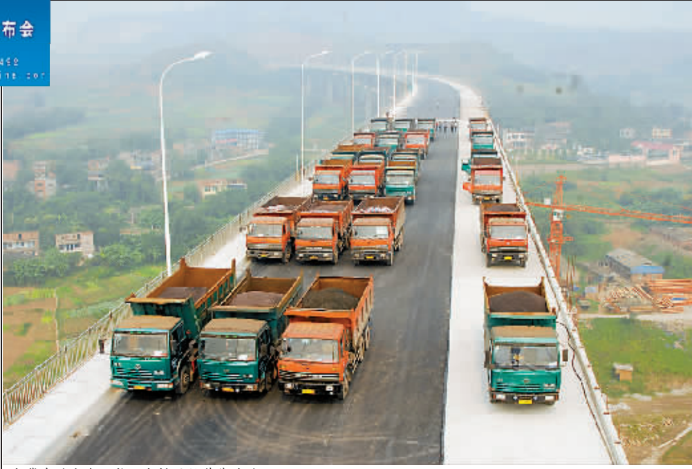
大货车驶上鱼洞长江大桥开始荷载试验

他说,市政府正在启动《主城区公交线网优化的编制》,结合新增轨道交通站点、道路桥梁设施等,逐年优化公交线网,确保不会因交通站点调整而给市民出行带来不便。