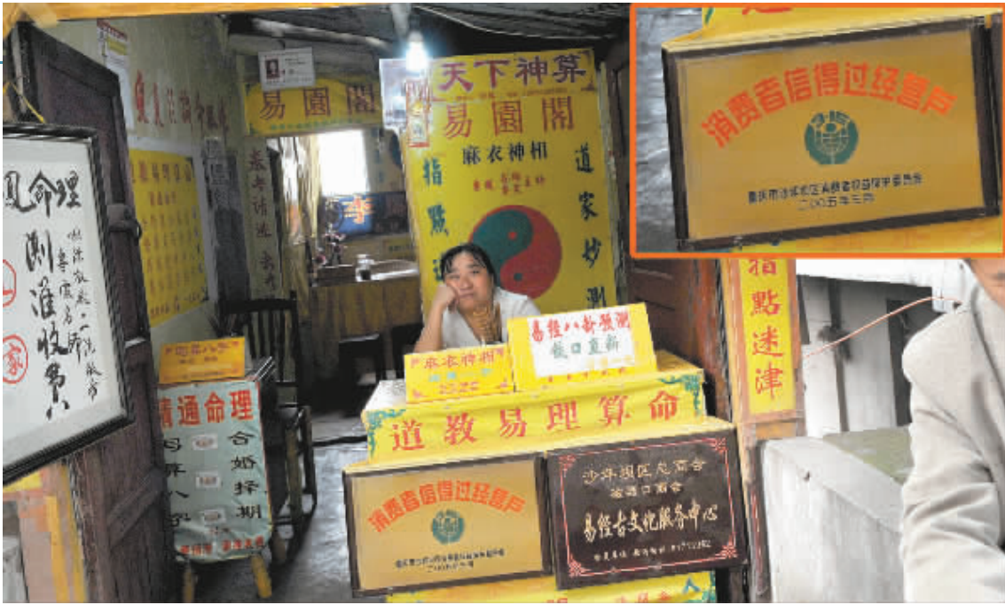
“消费者信得过”牌子挂在算命店门前