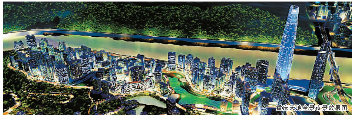
重庆天地夜景效果图

10月23日,入渝5年的瑞安房地产首次亮相本市房交会。作为深耕重庆的港资房企初志超级“秀场”,瑞安房地产的踴跃参与,将在某种程度上丰富和提高本次房交会参展商的档次和规模。