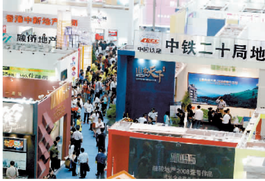
融侨地产2008秋季房交会现场

从参与此次活动的企业和楼盘来看,不乏众多知名品牌和项目的踪影。 庆隆·南山高尔夫国际社区重点推出的3期“橘香郡”,是目前重庆少有的一线高尔夫景观联排别墅,加上该组团采用“四个院子 一栋别墅”的新颖设计,可谓联排享受独栋待遇。