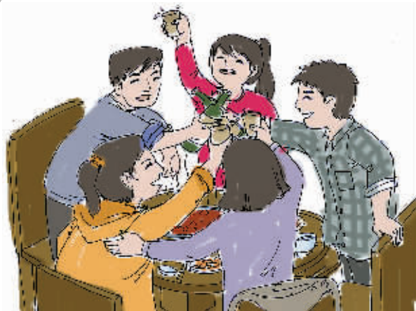
同学聚在一起吃火锅喝啤酒