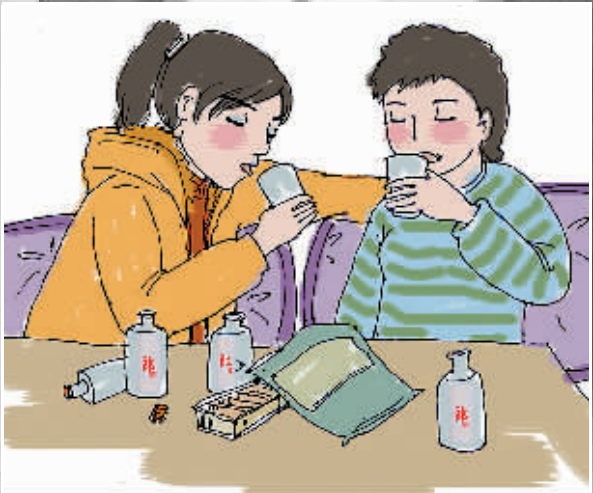
与要好同学回家喝郎酒