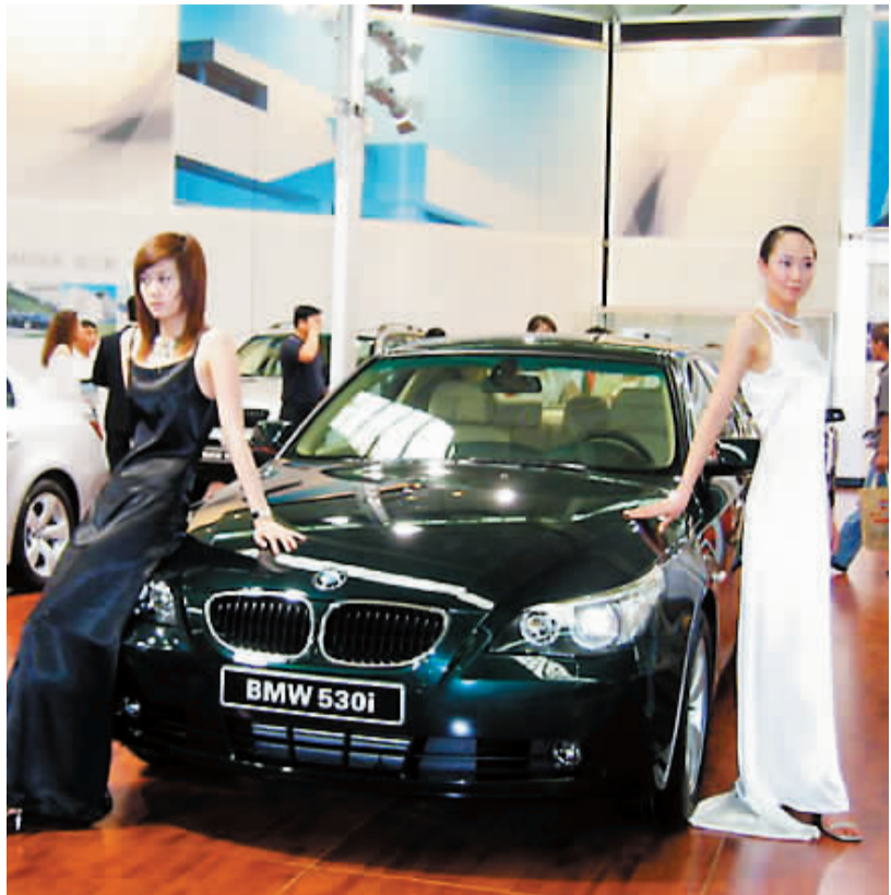
车市不再是厂家的秀场,“防暑”还需真本领。

备受业界瞩目的“重庆车市营销精英沙龙”自成立以来,举办了一系列饶有情趣且影响深远的活动,已逐渐成为本土车界人物们畅所欲言的学习交流平台。此次,沙龙移师中汽西南汽博中心,诚邀数位车市精英,就本期话题展开了讨论。