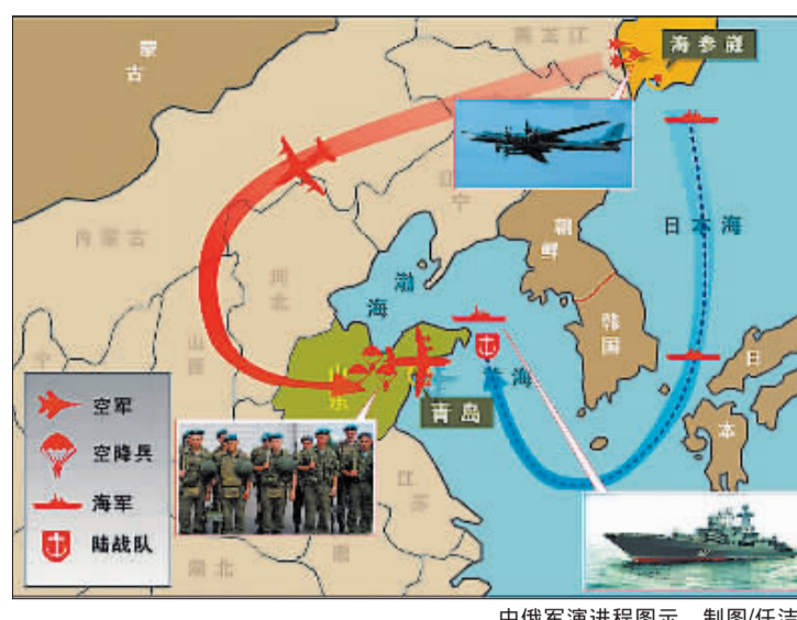
中俄军演进程图示 制图/任洁

核心提示 当地时间18日上午11时(北京时间18日上午8时),中国人民解放军总参谋长梁光烈上将和俄罗斯联邦武装力量总参谋长巴卢耶夫斯基大将在俄罗斯符拉迪沃斯托克共同宣布,“和平使命-2005”中俄联合军事演习正式开始。 “和平使命-2005”中俄联合军事演习18日至25日在俄罗斯符拉迪沃斯托克和中国山东半岛及附近海域举行,中俄双方派出陆、海、空军和空降兵、海军陆战队以及保障部(分)队近万人参加演习。双方实兵实弹演习将在中国山东半岛举行。