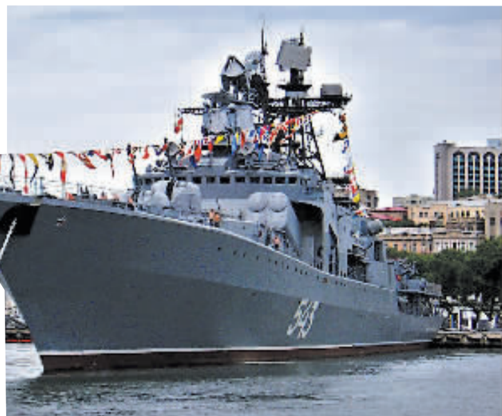
本版稿件综合新华社、中新社、青年参考

针对这次的军演,日本防卫厅18日表示,担忧中俄两国加强军事合作。 日本NHK电视台报道,日本防卫厅对本次的中俄联合军演表示,两国不断强化军事关系,将会对亚洲区域造成威胁,必须加强警戒。NHK同时也引述日本防卫厅长官大野功统的意见,表示中俄联合军演虽然目前对于日本周边的安全,没有立即的威胁性,但是未来的影响可能会逐渐加大,中俄两国似乎旨在牵制中国台湾问题作为安保共同战略目标的日美安保体制。 东森新闻说,事实上,对于大陆军事实力不断增强,日本也有准备,根据日本“产经新闻”的报道,日本防卫厅计划在2009年前,添置24架F15鹰式战斗机,以提升的防御能力,另一方面也增强日本自卫队与美军联合作战的能力,并且加速美日两国在亚洲地区的安全合作结构。 除此之外,日本政府最近积极修改国防法案,加强自卫队的防御系统,让自卫队不需要中央下令,就可以直接还击。