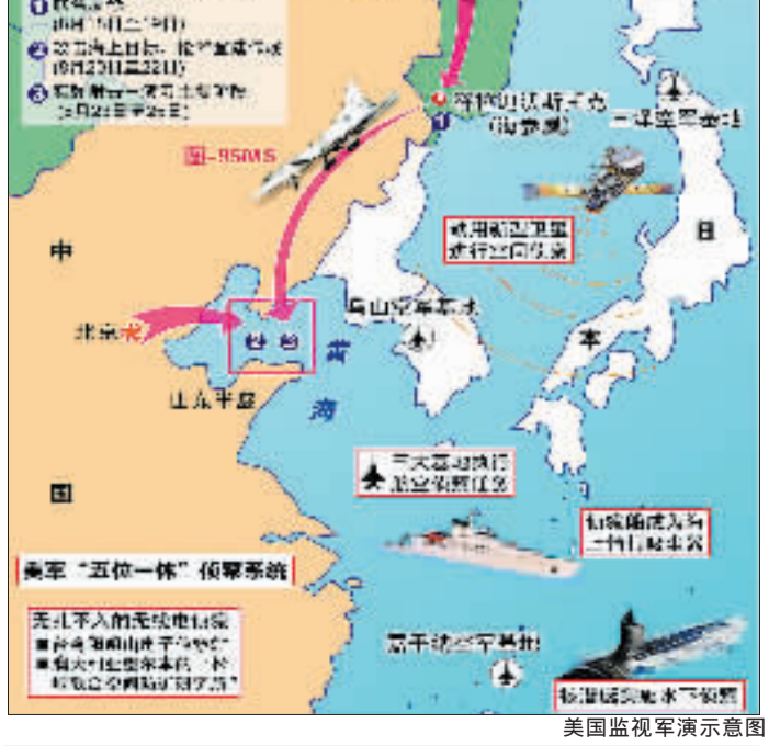
美国监视军演示意图

18日,有史以来第一次大型中俄联合军事演习在俄罗斯远东军港符拉迪沃斯托克正式开始。分析人士指出,中俄联合军演,一方面显示关系改善,另一方面也似乎向美国摆出姿态,表示不会容忍美国主导世界事务。观察人士指出,除美国外,日本也密切注视着此次军演的每一个细节。 美海军上将“我们很感兴趣” 新上任美国太平洋舰队司令加里·拉夫黑德海军上将18日表示,他将密切观视俄中双方动用哪些武器装备。拉夫黑德在接受美联社记者采访时说,他将视中俄两国使用什么样的装备以及他们怎样协调一致。 拉夫黑德说:“我们对他们演习一些十分感兴趣;我们也对他们演习系统的类型和复杂程度感兴趣。” 拉夫黑德不愿意谈论美国是否将派自己的舰只监视这次演习,他只是说,“我不想谈论我们军事行动的具体细节。” 一些分析人士指出,这次中俄大型军演,除了显示双边关系继续改善外,也包含俄军希望更多向中国出售武器的因素。这次军演,俄国