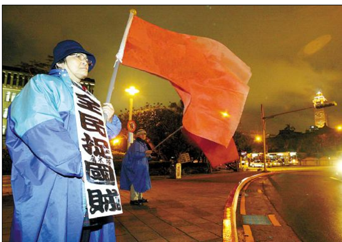
台湾民众悬挂标语上街反对台独

标上升,其余四项指标全数下降。台经发展中心主任朱云鹏表示,民众消费信心往往会受到当时新闻事件的影响,而这次的调查时间2月17日到19日,冲击民众信心的原因包括油价和非经济因素。至于什么是非经济因素?台经院研三研究所所长戴肇洋认为,主要就是陈水扁“废统论”引起岛内政治环境对立冲突升高。(据厦门日报)