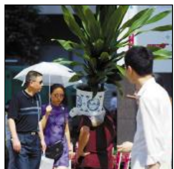
昨日一男子肩扛花盆走在解放碑步行街上,远望就像戴了个怪异的头盔。

医院保安报警。110、119先后赶到现场,继续劝说,仍无效。13时20分左右,消防队决定强行上树救人。为保安全,他们在树下铺设气垫,岂料该男子见状纵身跳下。(记者 朱亮)