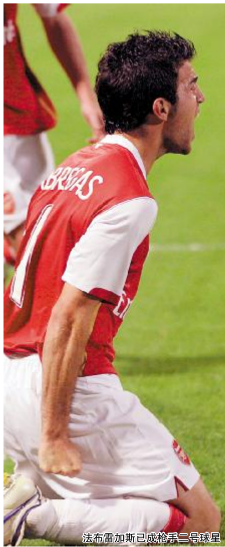
法布雷加斯已成枪手三号球星

弱的行为不应再存在下去。以前,重要的决策往往是个别人作决定,从现在起,我们将致力于创造一个和谐和彼此尊重的环境。”