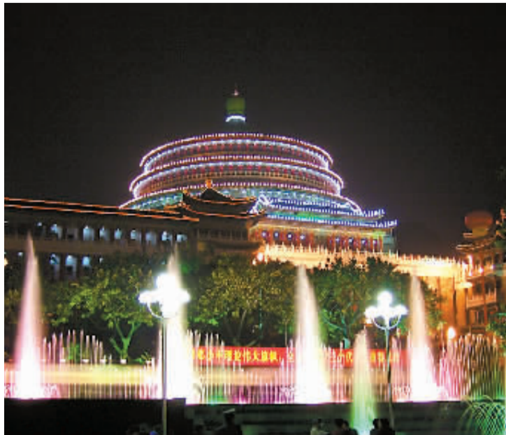
大礼堂 上榜理由:这是重庆最具代表性的建筑之一,体现了建筑特色,规模宏大。不久前参加全国夜景灯饰评选,获得一等奖。