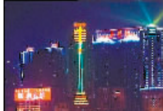
金紫门大厦 上榜理由:专家认为这是重庆灯饰从简单的装饰建筑轮廓,到自成艺术形象,展示文化品位的开端。