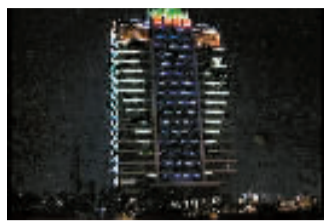
科技大厦 上榜理由:采用LED光源,节能环保,变化形式丰富,和建筑融为一体。