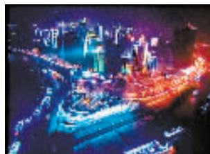
朝天门 上榜理由:整组灯饰用白色为主调,沿着广场的台阶布置,如同一层层甲板,好像一艘巨轮的船头。

本报讯 市政府昨天决定,启动第十二期灯饰工程建设,再建43处夜景灯饰,并改造175项以前建设的老灯饰。