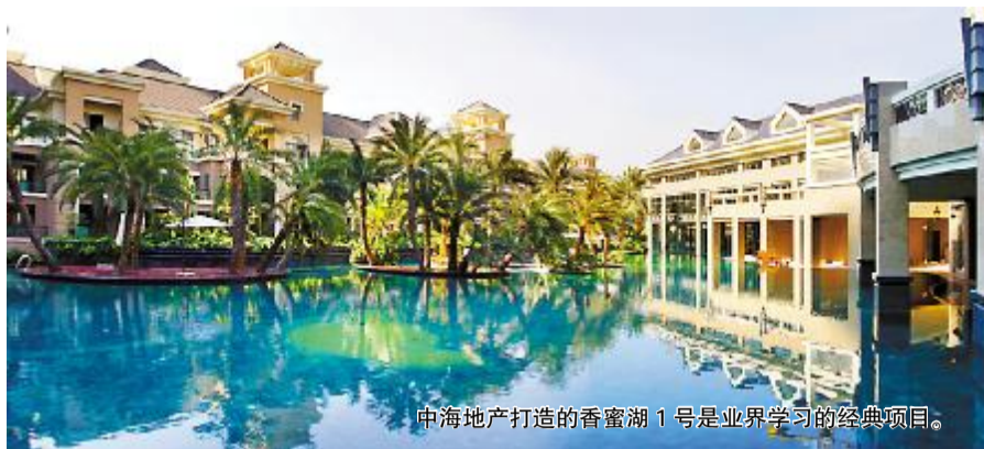
中海地产打造的香蜜湖 1 号是业界学习的经典项目。

在中国拥有 N 个“第一”头衔的中海地产本周正式亮相重庆,选择在新年期间正式亮相,预示着这个中国头号地产巨鳄的第 15 家区域公司将在 2007 年的重庆楼市全面发力。