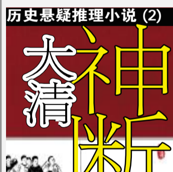
历史悬疑推理小说 (2) 大清神断 河边 著

玄妻说:“这第一碗酒,陛下不能喝,应该是奴婢来喝。”后羿不知道她为什么要这么说。