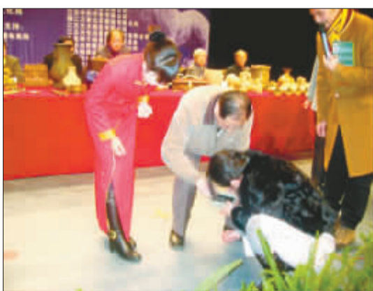
古镜摔碎,众人收拾残片

央视《艺术品投资》栏目“进丹阳”两天来好戏连台,但在14日压轴大戏——评选的“2007民间寻宝记——走