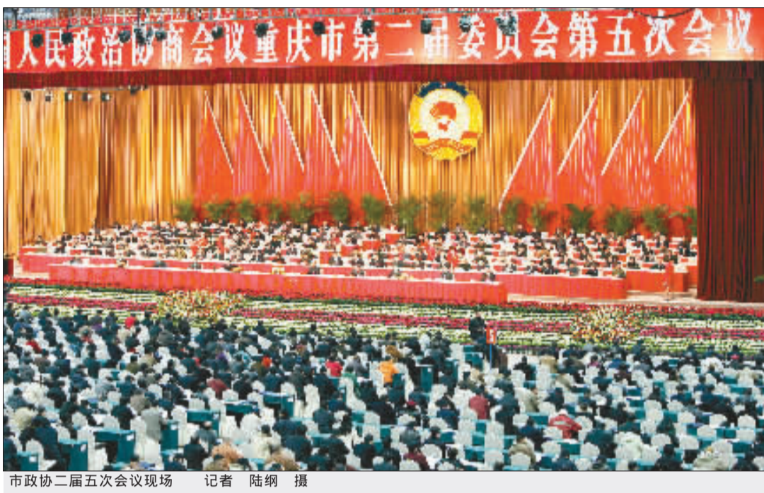
市政协二届五次会议现场