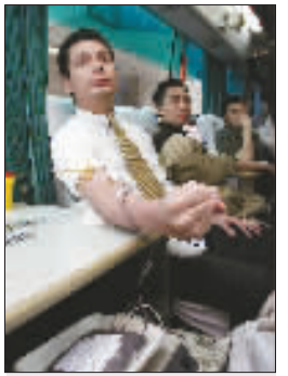
马历献血显得比较轻松