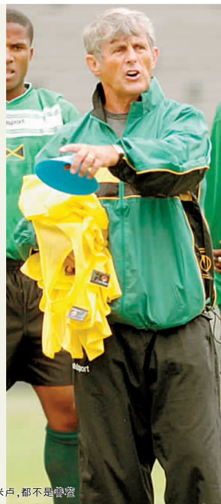
无论杜伊还是米卢，都不是鲁宾